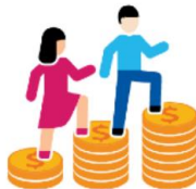
增长中的中产阶级